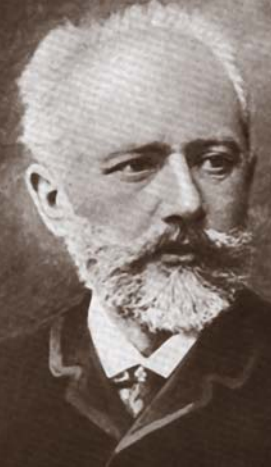
PJOTR ILJITSJ TSJAIKOVSKI

Ondanks het feit dat Pjotr Iljitsj Tsjaikovski al op vierjarige leeftijd stukjes voor zijn moeder componeerde zag vader Tsjaikovski niets in een muzikale loopbaan voor zijn zoon. Naast een klassieke scholing kreeg hij pianolessen van uitstekende docenten, maar hij werd opgeleid tot jurist, en tot zijn zesentwintigste werkte hij op een kantoor. De muziek bleek sterker, en Pjotr schreef zich in aan het Conservatorium van St. Petersburg. Een opleiding als pianist was gezien zijn leeftijd geen optie meer, maar zijn theoretische studies verliepen zo vlot dat hij na twee jaar benoemd werd tot docent in de harmonieleer aan het net opgerichte conservatorium van Moskou. Zes jaar later, op de drempel van internationale roem, sloeg het noodlot toe.